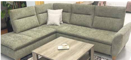
Sedacia súprava s rozkladom