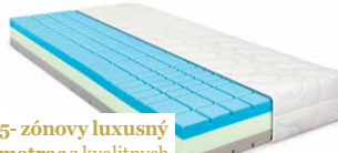
5-zónový luxusný matrac z kvalitných studených pien, vybavený prateľným poťahom Dry Fast