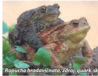
Ropucha bradavičnatá

Krkali dve žaby. Zaujímavé na tom je, že to boli chlapi, pretože samice nemajú rezonančné mechúriky na vydávanie zvuku. Bolo to také bežné krkanie o ne- podstatných témach. Keď už celkom nebo- lo o čom, skončili pri počasí. Veru, sucho je. Široko-ďaleko žiadny močiar, ani poriadna kaluž. Bolo by to veľ- mi bezútešné, keby nebola jar a s ňou spo-