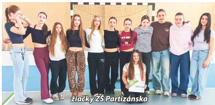
žiačky ZŠ Partizánska