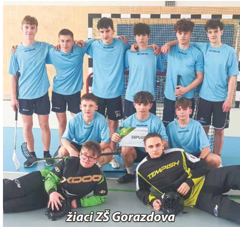
žiaci ZŠ Gorazdova