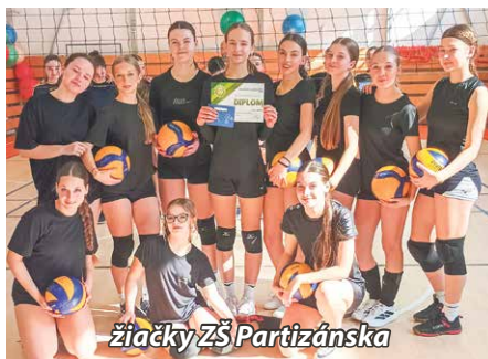
žiačky ZŠ Partizánska

okresných kôl vo volejbale žiakov a žiačok základných škôl, ktoré sa uskutočnili v telocvični na ZŠ Partizánska. V utorok 10. marca si