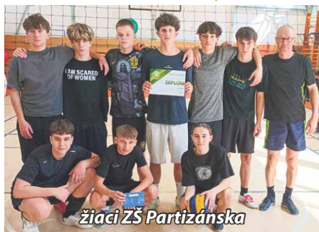
žiaci ZŠ Partizánska

Gorazdova - ZŠ Komenského 2:0, ZŠ Duklianska - ZŠ Komenského 2:0. Celkové poradie na prvých troch miestach bolo nasledovné: žiaci: 1. ZŠ Partizánska, 2. ZŠ Gorazdova, 3. ZŠ Duklianska. Žiačky: 1. ZŠ Partizánska, 2. ZŠ Gorazdova, 3. ZŠ Rybany. Obidvoch okresných kôl vo volejbale sa spolu zúčastnilo 38 žiakov a 64 žiačok zo siedmich základných škôl nášho okresu. Dievčatám aj chlapcom zo ZŠ Partizánska blahoželáme k prvým miestam a prajeme ďalšie športové úspechy v regionálnom kole, ktoré sa odohrá v mesiaci apríl v Prievidzi. Milan Král