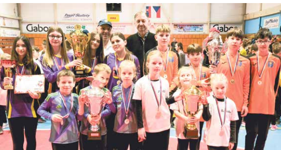
najlepšie tímy z nášho okresu získali Putovné poháre primátora mesta Bánovce nad Bebravou

Z dôvodu objektivity sa výsledky vyhodnocovali samostatne pre domáci Bánovský okres a samostatne pre hostí z okolitých okresov.