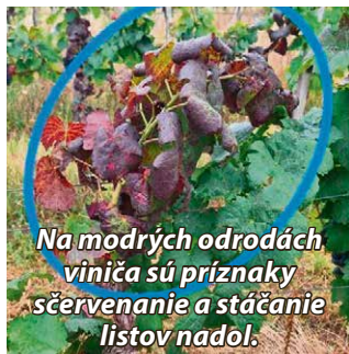
Na modrých odrodách viniča sú príznaky sčervnenie a stáčanie listov nadol.

Upozorňujeme vinohradníkov a záhradkárov na výskyt nebezpečného karanténneho ochorenia viniča – Zlaté žltnutie viniča (Grapevine Flavescence dorée) , ktoré sa šíri najmä prostredníctvom cikádky Scaphoideus titanus . Táto choroba môže veľmi rýchlo úplne zničiť vaše vinohrady. Preto je potrebné sa jej zbaviť, kým nie je rozšírená.