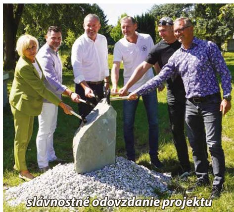
slávnostné odovzdanie projektu