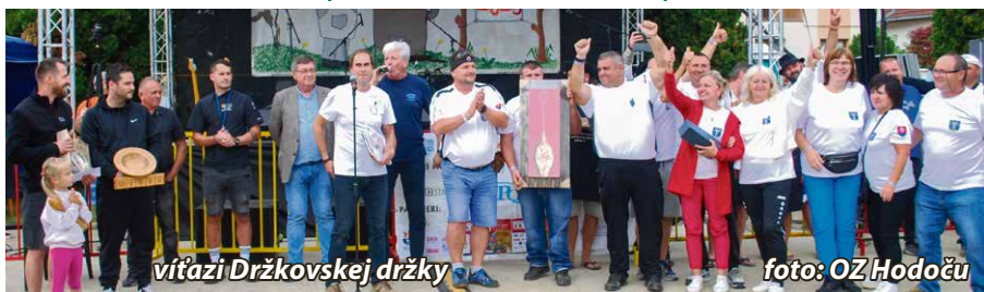
víťazi Držkovskej držky

V sobotu 23. augusta sa v Horných Držkovciach uskutočnil už 15. ročník obľúbenej Držkovskej držky. Ani tento rok nesmela chýbať jej hymna, ktorú zahráli a zaspievali organizátori z OZ HODOČU, čím v podstate odštartovali samotnú súťaž. Súťažné tímy, ktorých bolo tento rok 22, nedbali len na kvalitu varenej držkovej, ale aj na estetickú stránku. V kategórii s presným názvom Gastronomická