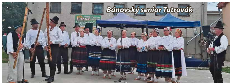
Bánovský senior Tatrovák