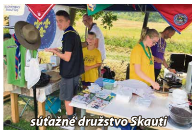
súťažné družstvo Skauti

vzoriek a pridelení bodov od poroty Veselá partia z Kravej doliny . Výsledky súťaže sa tímy dozvedeli z úst predsedníčky poroty - poslankyne