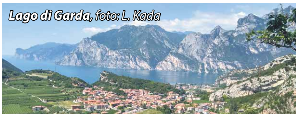
Lago di Garda

de, kde zažili neopakovateľné dobrodružstvá s malými Afričanmi a aj v safari. Prišli porozprávať o ich výlete v cyklistickom raji Lago di Garda v Taliansku, kde sa chcú určiť ešte vrátiť. Pavol Rusnák