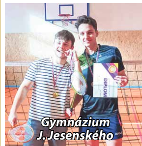
Gymnázium J. Jesenského

po odohraní všetkých zápasov bolo nasledovné: 1. ZŠ Gorazdova BN, 2. ZŠ Komenského BN, 3. ZŠ Partizánska BN,