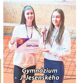
Gymnázium J. Jesenského

4. ZŠ Šišov. A nakoniec 31. januára sa odohralo OK v bedmintonе žiačok ZŠ v telocvični ZŠ Gorazdova za účasti piatich škôl nášho okresu a po odo-