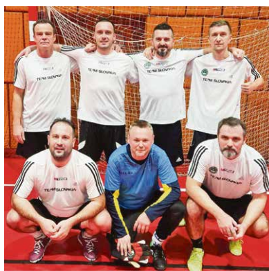
Vítaz turnaja FC Capri