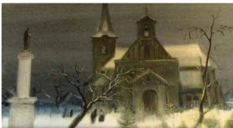
Kostol v Rybanoch, ako ho videl vo svojich spomienkach