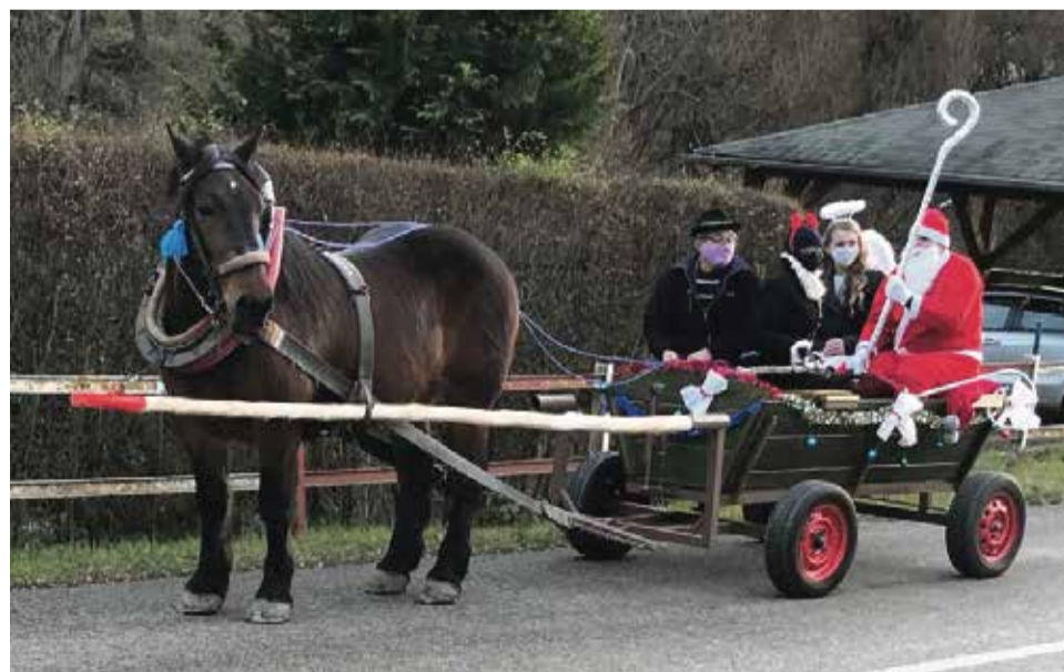
Aj napriek súčasnej nepriaznivej situácii Mikuláš na dobré deti v Kšínnej nezabudol a so svojou družinou na voze s koníkom prejazdil celú dedinu. Podľa reakcií potešil tak nielen mladšiu ale aj staršiu generáciu občanov tejto pohorskej obce... (tb)