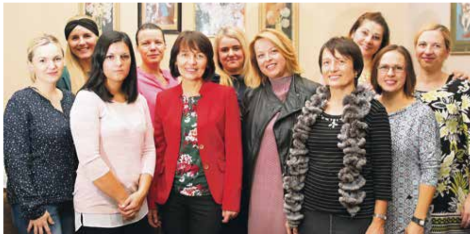
Výročie založenia materského centra si pripomenulo časť aktívnych mamičiek