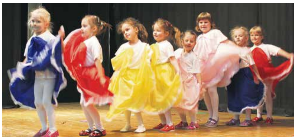
Kankán v podaní tanečníčok z MŠ Komenského