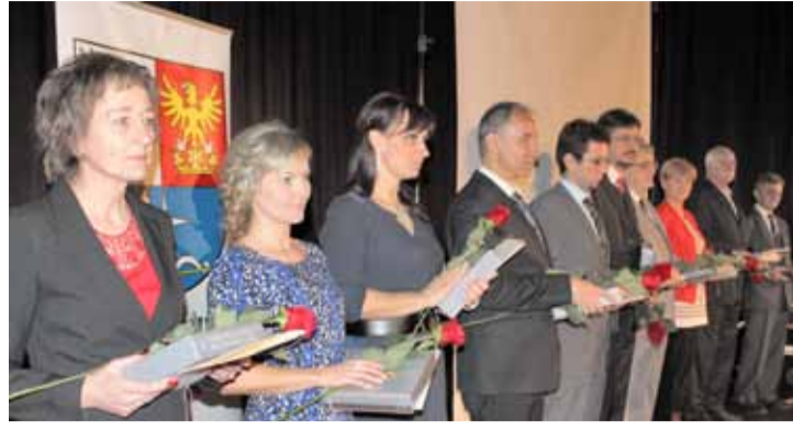
Desiaty ocenení bývalí i súčasní pedagógovia a zamestnanci gymnázia