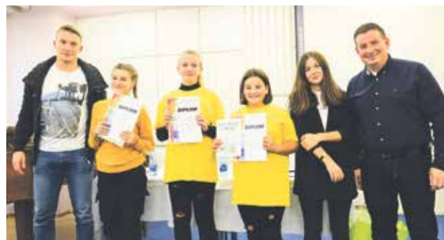
Špeciálnu cenu v tejto kategórii získala reportáž Deti z planéty DS , na foto autorky s odbornou porotou