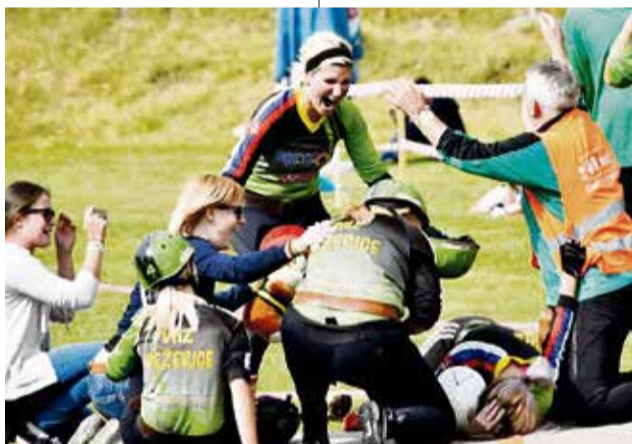
Posledné kolo SMHL v Ďurďovom a radosť z víťazstva

Ak by ste čakali, že za tým stála tvrdá zimná príprava, pot a drina, musíme vás sklamať. My sme si to pred sezónou len upratili v hlavách, utužili sa a naladili na rovnakú vlnu. Nesilili sme to. Kto chcel trénovať, trénoval.