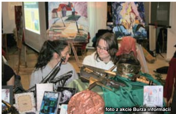
foto z akcie Burza informácií