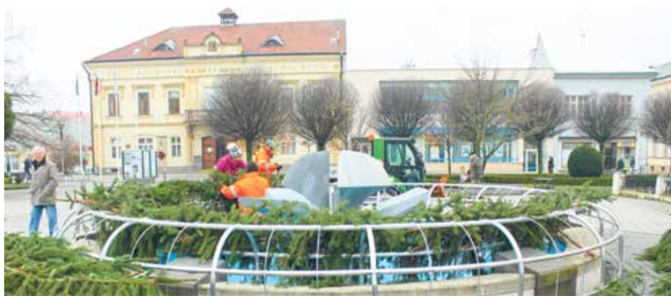
V piatok sa fontána menila na veľký adventný veniec