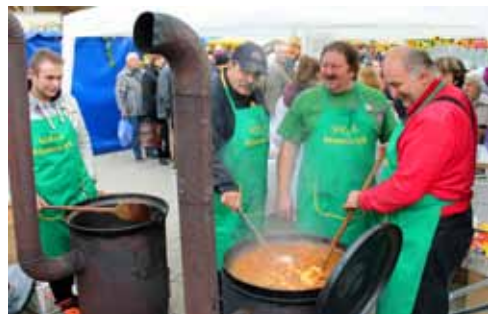
Guláš od kuchárov zo SOŠ J. Ribaya sa minul už na poludnie, aby uspokojili dlhý rad čakateľov, museli navariť ďalšie dva kotly...

Tohtoročný tradičný jesenný bánovský jarmok bol v úvode opäť poznačený drobným dažďom, ale najmä sobota už bola plná slniečka. A keďže ten náš bol jeden z posledných, záujem bol veľký nielen zo strany kupujúcich, ale aj jarmočníkov. Obzvlášť bola pestrá ponuka burčiaku a remeselných výrobkov. Ľudí zo širokého okolia prilákal aj bohatý kultúrny program, ktorý otvárali žiaci zo ZŠ Komenského, DFS Cífrulienka, Základnej