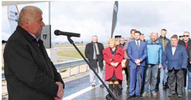
Príhovor ministra si so záujmom vypočuli poslanci MsZ a prednosta OÚ