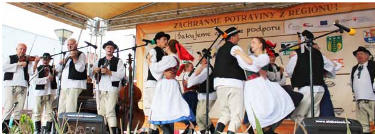
Folklóristi z Bukoviny zo Kšínnej zavřili plejádu domácich ľudových tradícií odštartovaných Drienovcom, pokračujúc Bebranom a folklórnou skupinou Uhrovčan...