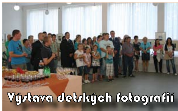
Výstava detských fotografií

Za blýskania desiatok fotobleskov bola 6. septembra v Mestskom kultúrnom stredisku v Bánovciach nad Bebravou vernisáž výstavy Milotice špendlíkovou dierkou. V rámci programu cezhraničnej spolupráce Fondu mikroprojektov EÚ výstavu pripravili obce Milotice a Miezgovce. Lepšie povedané deti a mládež z týchto obcí a ich okolia, účastníci 5. prázdninovej fotodiely. Výsledky ich práce s kamerou obscurou si môžu návštevníci strediska pozrieť do konca septembra. Vidieť ich sa naozaj vyplatí. bk