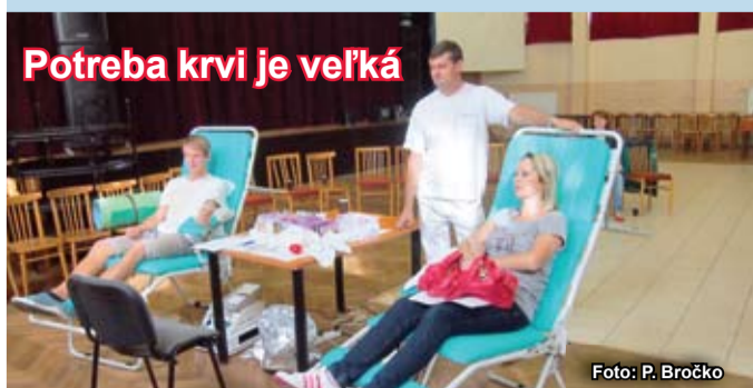
Potreba krvi je veľká