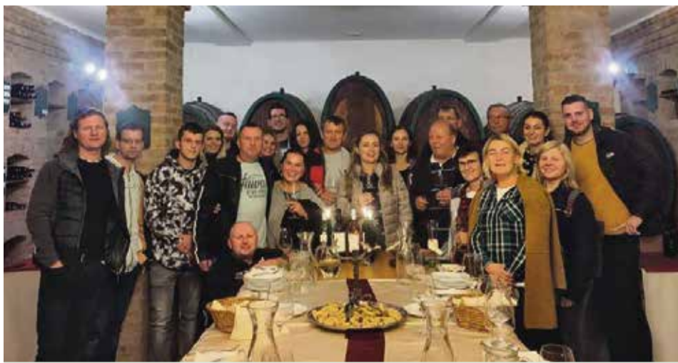
Degustácia najkvalitnejších slovenských vín v podzemných pivniciach

Naša cesta za príjemného slnečného počasia následne smerovala na Smolenický zámok. Patrí určite k jednému z najkrajších skvostov našej histórie. Hodinová prehliadka a podrobný výklad pracovníčky SAV (pozn. SAV spravuje zámky Budmerice, Smolenice a Červený kameň...) nás opäť obohatil o množstvo informácií o tomto zaujímavom historickom objekte, ktorý má aj v dnešnej dobe široké využitie. Prvé písomné pamiatky o existencii obce Smolenice pochádzajú z polovice 13. storočia. Ako majitelia panstva sa vystriedali viaceré šľachtické rody, ako napr. Ctibor zo Ctiboric, pezinický a svätoujurský