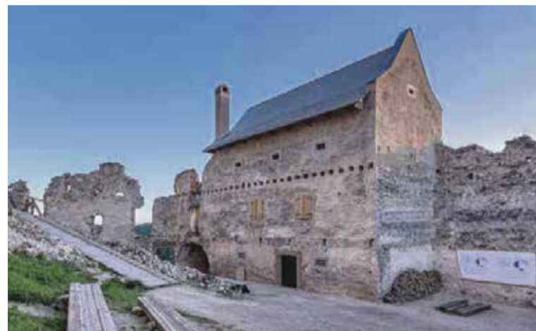
Hospodárska budova po komplexnej obnove.