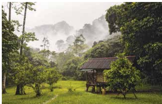
Dobrovoľnícky camp - rezervácia Green Life, Sumatra

Našou hlavnou aktivitou je vykupovať od miestnych ľudí pozemky dažďového