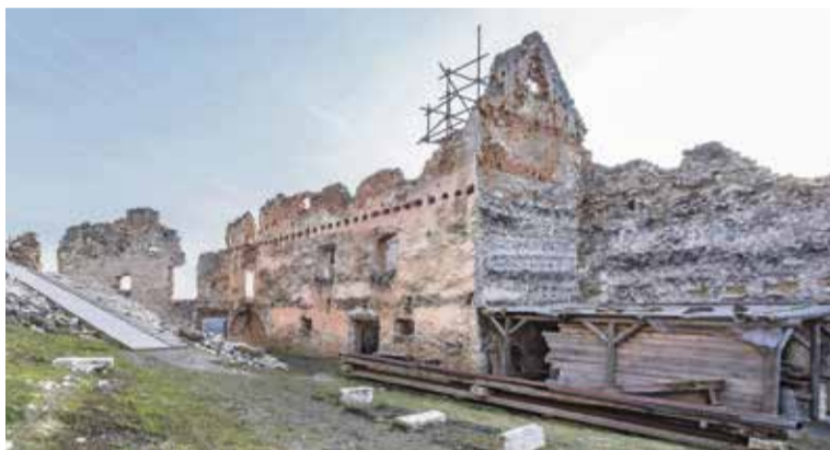
Hospodárska budova pred obnovou.