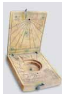
Slnečné hodiny, najstaršie na Slovensku

Moje zvedavé otázky zdržujú dobrovoľníkov v ruinách od práce, preto ich opúšťame. Je fantastické, že „náš“ hrad je v dobrých rukách. So želaním pekného počasia a s prísľubom, že o aktivitách na hrade budeme informovať Bánovčanov i Uhrovčanov častejšie. Snáď sa v nich prebudí lokálpatriotizmus a nenechajú všetko len na Bratislavčanov. Sadáme s kolegami do vysokánskej kabíny liazky. Na vlečku si netrúfa ani jeden z nás. Aj keď sme sa o zručnosti šoféra už presvedčili. Ostré zákruty dolu skalnatou lesnou cestou absolvujem so zavretými