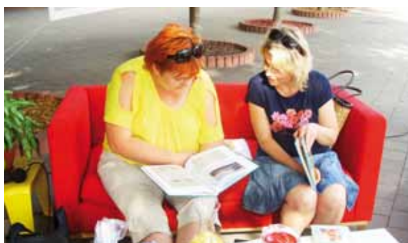
Prázdninovou aktivitou bánovskej knižnice je každý piatok verejná čítareň v „obývačke“ pod platanom na námestí

vania. Dotácia mesta v roku 2014 umožnila investovať na nákup literatúry 2631 eur a v roku 2015 už len 1596 eur. V súčasnosti knižničný fond tvorí 13 635 odborných titulov pre dospelých a 11 277 titulov pre deti. Tento stav sa začína prejavovať na znížených počtoch návštev študentov od 16 do 29 rokov, medziročne o 144. Pritom v meste počet študentov navštevujúcich vysoké školy narastá. Na druhej strane