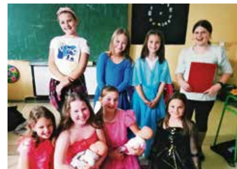
Divadelníčky zo ZŠ Komenského