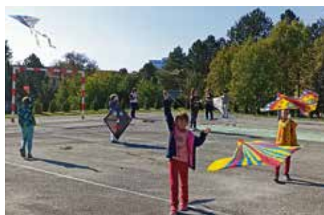
Šarkaniáda ZŠ Školská

Že býva v škole nuda??? U nás na hodinách hudobnej výchovy určite nie... Rozmýšľali sme, ako nájsť hudobné talenty v triede. Iskričky v očiach znamenali, že určite by to malo byť niečo zaujímavé. A tak nám napadlo – usporiadať známou spevacku súťaž SUPERSTAR . A táto čin-