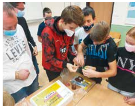
Žiaci robia fyzikálne experimenty

z fyziky, do ktorej sa zapojila aj ZŠ Duklianska v Bánovciach nad Bebravou. V piatok 24. septembra prebehol on-line program, kde si bolo možné pozrieť rôzne prednášky a experimenty. Program obsahoval aj modul vedecký kuriér a žiakom boli zaslané pomôcky na fyzikálne experimenty, ktoré boli realizované on-line. Na základe toho sme v utorok 28. septembra so žiakmi 7. ročníka uskutočnili hodinu experimentov, ktoré sme realizovali s pomôckami, ktoré sme dostali