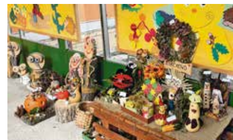
Jesenné dekorácie v MŠ Hollého

Mesiac september patrí v našej Materskej škole Primulka na Hollého ulici medzi výnimočné a hlavne kreatívne obdobie, na ktoré sa deti vždy veľmi tešia. V tomto období sa u nás každoročne organizuje súťažná výstava jesenných plodov. Rodičia, spolu so svojimi deťmi, prišli opäť s novými nápadi. Na vytvorenie jesenných dekorácií použili rôzny prírodný materiál ako tekvice, gaštany, šišky, kukuricu a mnoho ďalšieho, čím vznikli nádherné diela, ktorými oživil interier našej školy. Porota v zložení všetkých zamestnancov našej školy vybrala a ocenila najzaujímavejšie výrobky. No nezabudli sme ani