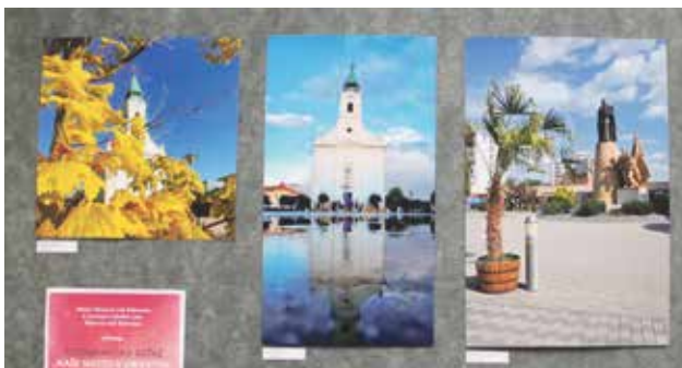
Vitazné fotografie v súťaži "Naše mesto v objektíve"