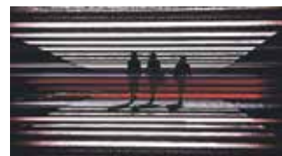
Cena primátorky: Z inej dimenzie