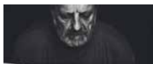
1. miesto: Starec a more

V Mestskom kultúrnom stredisku v Bánovciach nad Bebravou sa v sobotu 1. októbra konala vernisáž Salónu tvorivej fotografie členov Slovenskej federácie fotografův. Ide v poradí už o siedmy ročník výstavy amatérskej fotografie. Po vernisáži a odo-