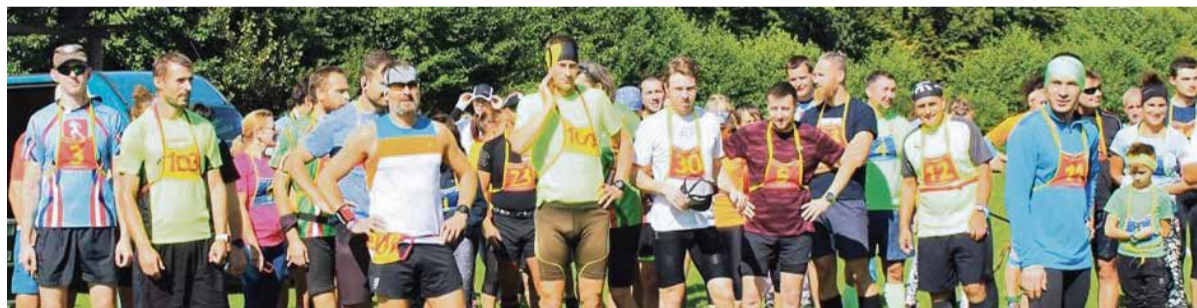
Štart poslednej BBL v tomto roku v Prusoch

Nateraz si dávame pauzu, odýchnite si, zregenerujte. Tešíme sa na 11. ročník Bánovskej bežeckej ligy v roku 2022. Organizačný tím BBL