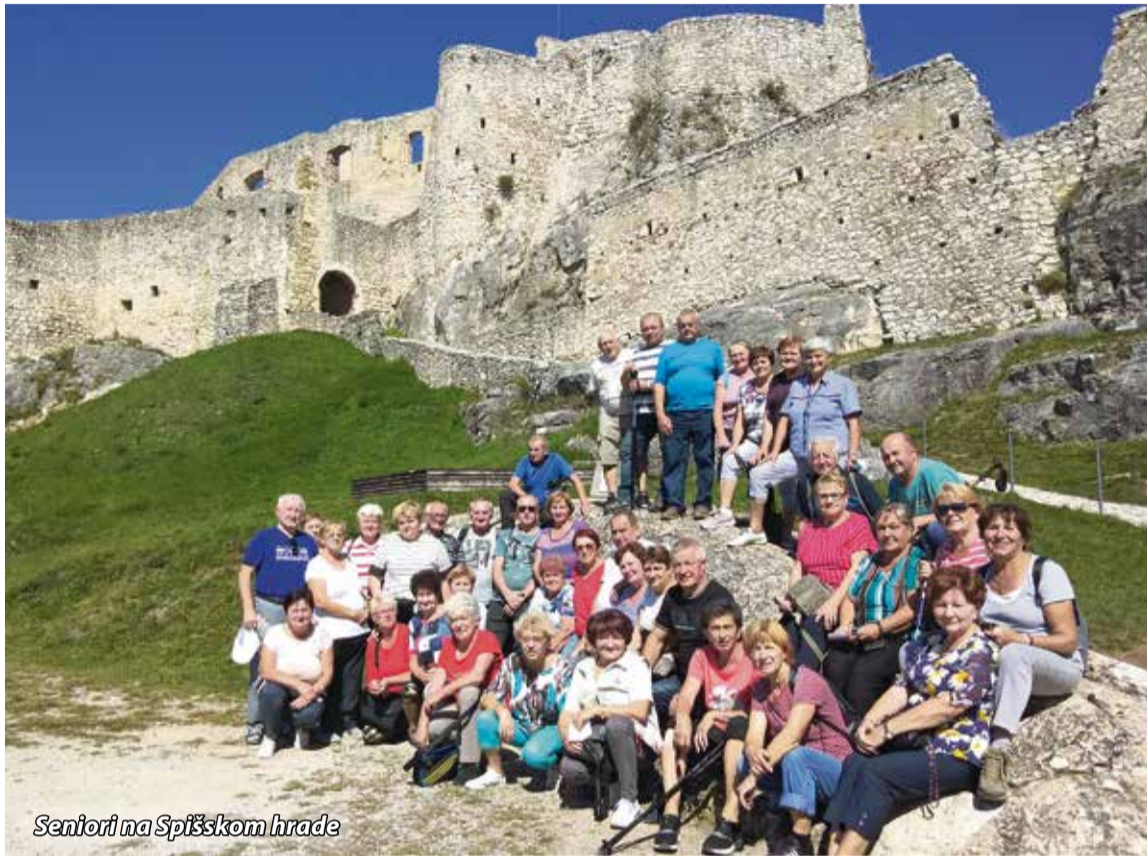
Seniori na Spišskom hrade

Ďalší deň nás čakala Levoča a jej kultúrne pamiatky. Prezreli sme si exponáty v radnici, Dom majstra Pavla z Levoče, kostol sv. Jakuba a Stredoveký kláštor minoritov. Všade sme sa stretli s ústretovým prijatím a zaujímavým výkladom sprievodkýň. Počasie nám prišlo,