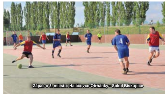
Zápas o 3. miesto: Haláčovce-Otrhánky - Sokol Biskupice

Spustením turnaja bol exhibičný zápas medzi bývalými hráčkami Gabor Bánovce a športovcami z Krásnej Vsi, ktorí rovnako museli spíňať prísnu podmienku, váhu každého hráča s číslom vyšším ako 100kg. V tomto atraktívnom zápase napokon zvíťazili hráčky Gabora hladko 6:1.