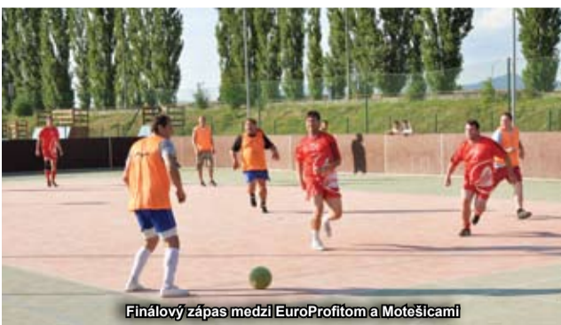
Finálový zápas medzi EuroProfitom a Motešicami