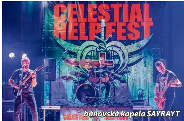
bánovská kapela SAYRAYT