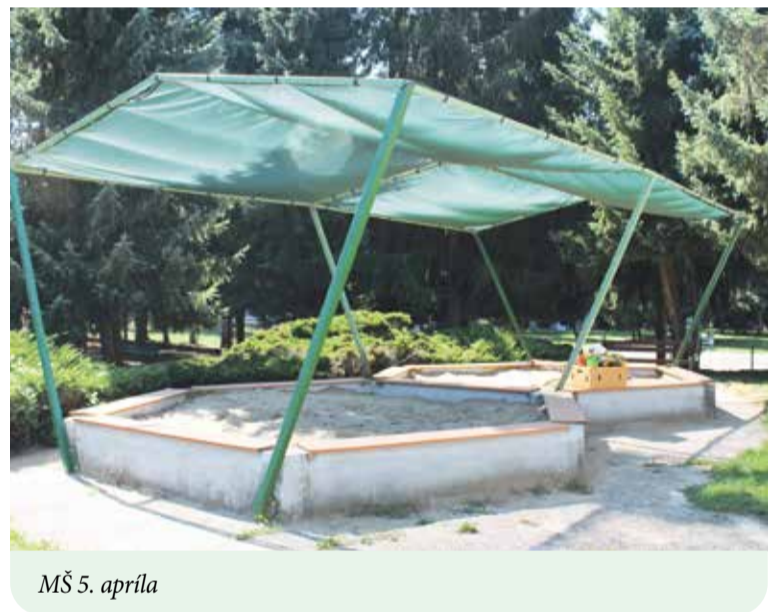
MŠ 5. apríla