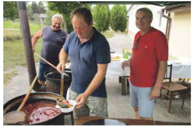
Členovia DHZ pri varení gulášu