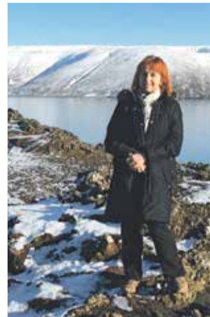
Na potulkách po Islande

Syn vyštudoval informatiku. Už počas štúdia na vysokej škole sa venoval spracovaniu obrazu. Má úžasný dar vidieť to, čo si iní možno nevšimnú. Práca je pre neho koníčkum, asi preto je taký úspešný. Recept na výchovu detí nemám. Riadila som sa inštinktom a verila som, že deti prevezmú dobrý príklad z rodiny. Že, ak by sa ocitli v "nesprávnej" situácii, povedia si, že toto predsa nechcem urobiť. Ja som to tak mala. Keby som aj chcela čosi "vyviesť", predstavila som si, čo by na to povedala moja mama – a nevyviedla som to. Podporovali sme deti v rozumných aktivitách, snažili sme sa zabezpečiť im kvalitné vzdelanie. Mali svoju dôveru, to je asi podstatné. Dnes sa tá dôvera premenila vo vzájom-