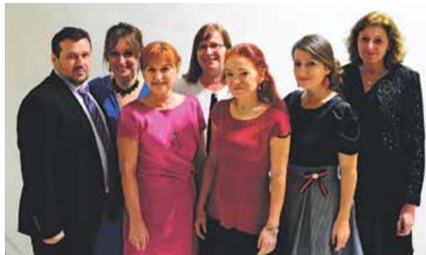
S kolegami z gymnázia

Je veľa vecí, ktorým som sa chcela venovať a popri škole som nestihala. Teším sa, že si naplním svoje osobné túžby. Chcem sa slobodne venovať sebe a svojej rodine, chcem cestovať, stretávať sa s priateľmi, hrabať sa v záhrade bez stresu, že nestíham... Nechcem sa nudiť. Potrénujem nemči-