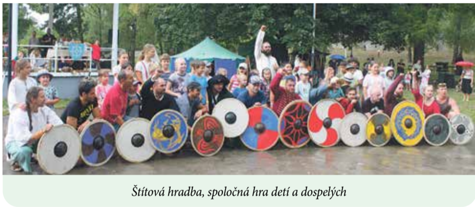
Štítová hra, spoločná hra detí a dospelých

Majstrovstvá vo varení drčkovej už po dvanásť raz