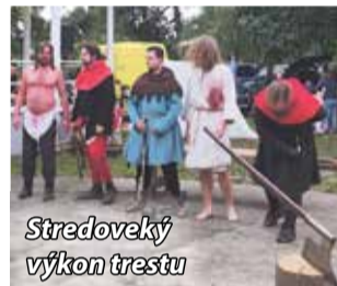
Stredoveký výkon trestu