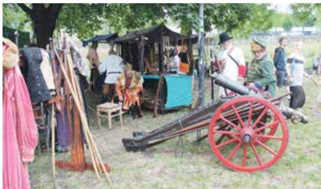
Dobový spolok Morová rana

remeselníci, stredoveká čajovňa, ukážky šermu, lukostreľba, bitka o Slamburg a dokonca aj ukážky stre-