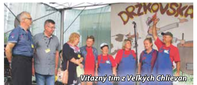
Vítaný tím z Velkých Chľevan