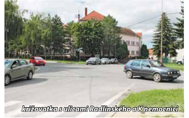
križovatka s ulicami Radlinského a K nemocnici