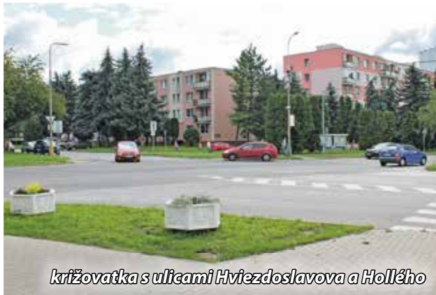
križovatka s ulicami Hviezdoslavova a Hollého

chádzalo sčítanie intenzity dopravy, ktoré bolo jedným z podkladov k vypracovaniu projektovej dokumentácie. Pristúpi sa i k úprave priechodov pre chodcov. Najväčšia zmena sa dotkne samostatného priechodu pre chodcov v blízkosti úradu práce, ktorý bude zrušený a presunutý priamo do križovatky. Priechody budú vybavené tlačidlami