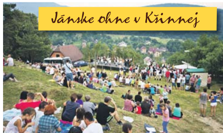
Jánske ohne v Kšinnéj

>>Skryté kamery zachytili drsné pozadie predvádzacích akcií pre seniorov !<<