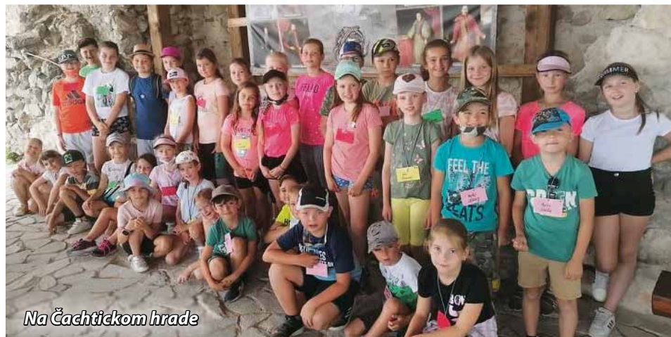
Na Čachtickom hrade

Prázdninová činnosť - Letná ŠKD. Takto sme nazvali týždeň aktivít pre deti našej školy počas letných prázdnin. Pedagogickí zamestnanci ŠKD a I. stupňa pripravili pre 90 detí každodenné výlety plné zážitkov a poznávania. Deti v rámci výletov navštívili ZOO Bojná, Trenčiansky hrad, Archeoskanzen Bojná, Čachtický hrad a Farmu Lubina. Po návrate z výletov ich čakal chutný obed v školskej jedálni a odychové hry v priestoroch školy. A na čo deti budú najviac spomínať? Každý má určite ten svoj „naj“ zážitok, napríklad: