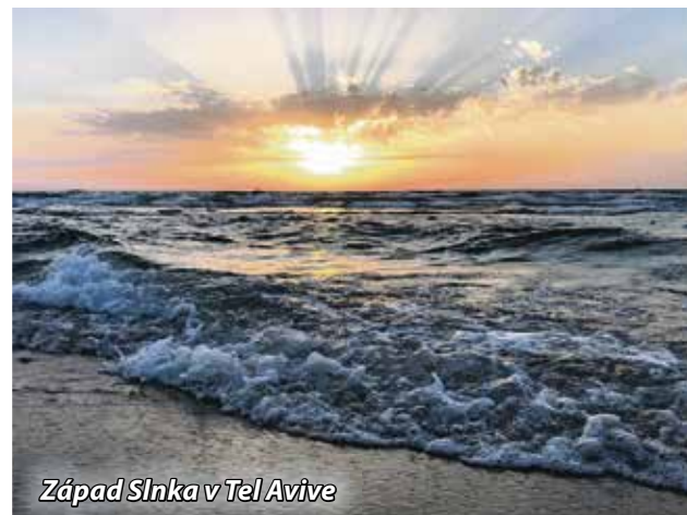
Západ Slnka v Tel Avive