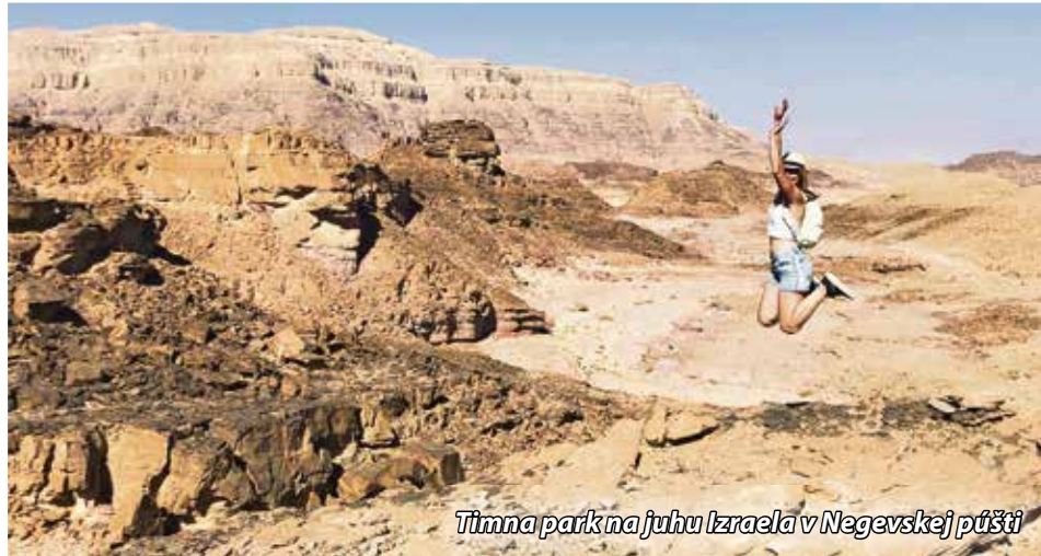
Timna park na juhu Izraela v Negevskej púšti

• Ako najradšej tráviš svoj voľný čas? Čo sa Ti na Izraeli najviac páči a čo by si našim čitateľom odporúčila navštíviť?