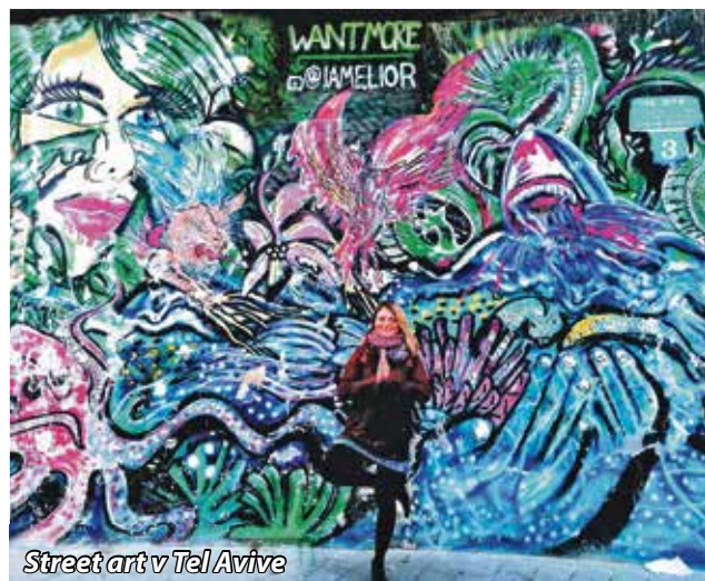
Street art v Tel Avive

Izraelisko - Palestínsky konflikt nás ovplyvňuje väčšinou vtedy, keď teroristická organizácia Hamas posieľa rakety z pásma Gazy smerom na Izrael. Nedeje sa to veľmi často, približne raz za pár mesiacov. Počas korony bolo napríklad „ticho“ skoro celý rok. Väčšinou sú zasiahnuté mestá na juhu pri pásme Gazy – Aškelon a Ašdot, my sme mali prvú sirénu až o niekoľko mesiacov po mojom príchode. Nijak som sa vtedy nebála, keďže Izrael je na tieto situácie pripravený a všade sú kryty. My sme mali jeden na poschodí a v Rehovote, kde som vtedy bývala sme mali minútu na to, aby sme sa dostali bezpečne do krytu. V Tel Avive je to napríklad minúta a pol a v Aškelone pár sekúnd. Veľkou výhodou Izraela je aj to, že má tzv. Iron Dome – systém protiraketovej obrany. Sú to vlastne ďalšie rakety, ktoré zostrelia tú nepriateľskú. Využívajú na to špeciálnu technológiu, ktorá presne vypočíta kam raketa letí. Úspešnosť Iron Domu je naozaj vysoká, takže keď aj sú na Izrael vyslané rakety, vieme, že ich Iron Dome zachytí a sme v bezpečí. V máji tohoto