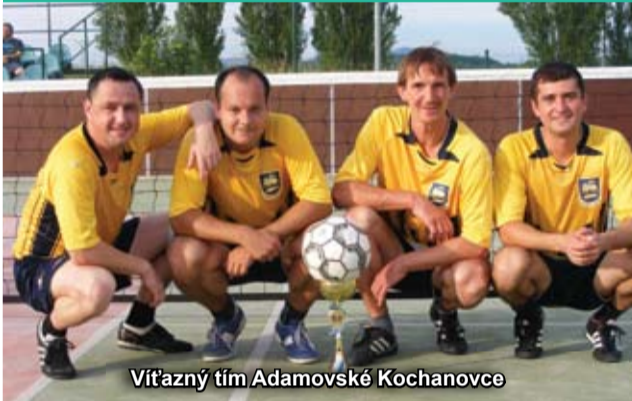
Víťazný tím Adamovské Kochanovce

Bánovská nohejbalová liga pokračovala uplynulý týždeň rozhodujúcimi play off zápasmi.