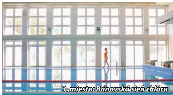
3. miesto: Bánovská sieň chlóru

vzdali vecné ceny. Tešíme sa na organizáciu tretieho ročníka, ktorý bude prebiehať v budúcom kalendárnom roku. Veríme,