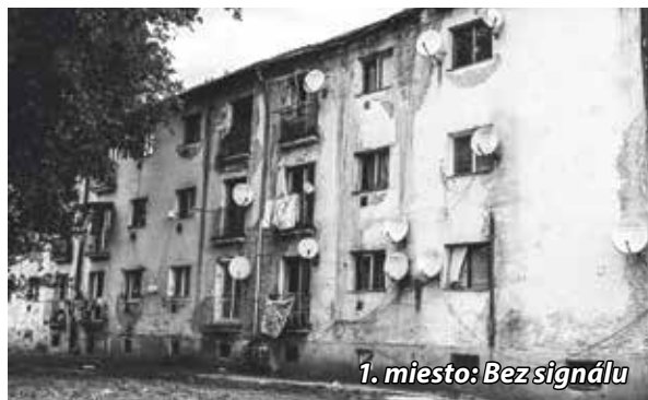
1. miesto: Bez signálu

Začiatkom septembra sme uverejnili výzvu pre nadšencov fotografie v našom meste. Tematicky sa súťaž viazala na mesto Bánovce nad Bebravou, no bolo možné ju poňať z hľadiska tvorby oveľa širšie.