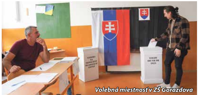
Volebná miestnosť v ZŠ Gorazdova

V meste Bánovce nad Bebravou sa volilo v 18 volebných okrskoch. Z 13 800 oprávnených voličov prišlo k volebným urnám 9 494, čo je účasť