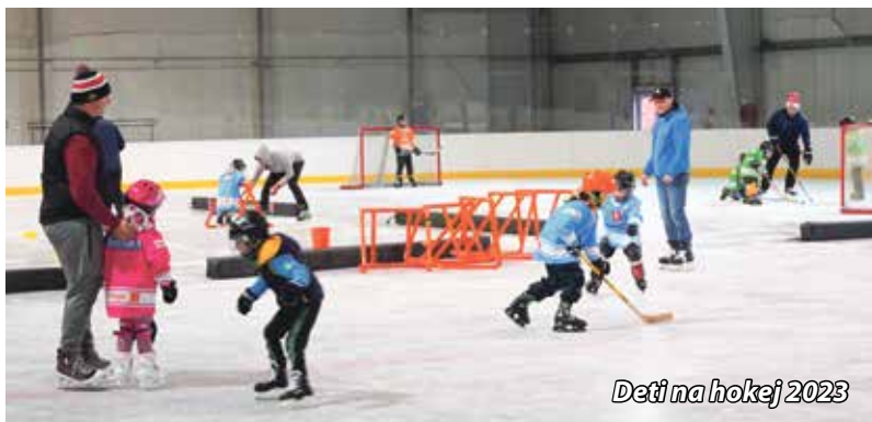
Deti na hokej 2023

Zimný štadión spustil ľadovú plochu do prevádzky 16. septembra. Prvou akciou bolo tradičné náborové podujatie Deti na hokej, kedy prišlo na „zimák“ približne 50 detí. Tréneri HK Spartak si pre ne pripravili veľa rôznych disciplín a prekážkovú dráhu. Rodičia, ktorí veľmi uvítali túto akciu, tak mali možnosť vyskúšať, či ich dieťa má záujem o korčuľovanie, či hokej. Aktuálne má HK Spartak 50 detí v prípravke, v kategórii 6. ročník 15 detí a v 4. ročníku 15 detí. Pre mladé hokejové nádeje sa vedeniu klubu podarilo počas tohto leta zorganizovať letné sústredenie, a to aj vďaka prvému ročníku Hokejového plesu, z ktorého výťažok pokryl väčšinu nákladov. Tréningy prípravky bývajú pravidelne každý utorok o 16. 45 h a piatok o 17.15 h.