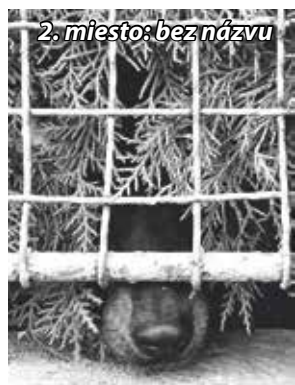
2. miesto: bez názvu

Začiatkom septembra sme uverejnili výzvu pre nadšencov fotografie v našom meste. Tematicky sa súťaž viazala na mesto Bánovce nad Bebravou, no bolo možné ju poňať z hľadiska tvorby oveľa širšie.