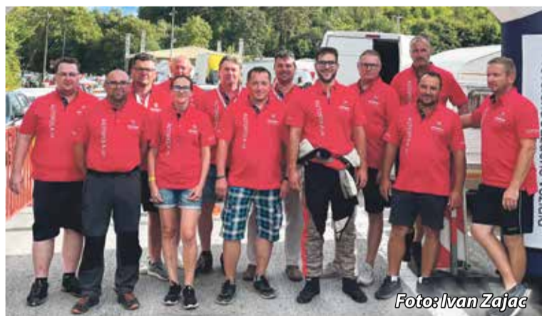
Organizátori z Motosport Bánovce nad Bebravou