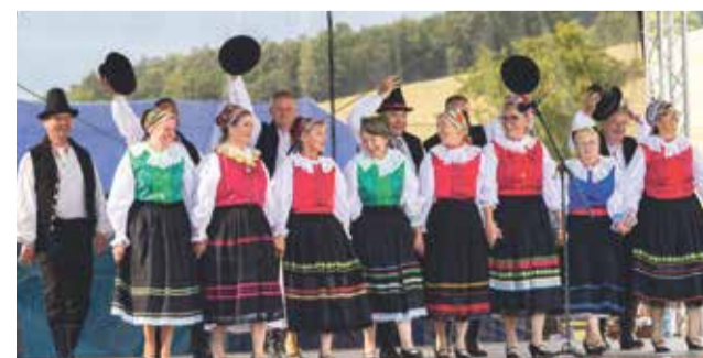
Bánovský senior Tatrovák

Áké by to bolo leto bez folklórnych vystúpení?