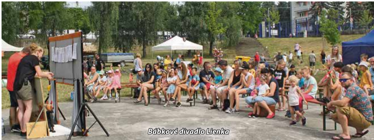
Bábkové divadlo Lienka

Náš mestský park sa stal v sobotu opäť dejiskom ďalšieho skvelého programu v rámci Kultúrneho leta 2021. (Ne)tradičný jarmok a minifestival Tu žijem sa vzhľadom na „protipandemické okolnosti“ uskutočnil v menšej forme. Našťastie každý, kto radšej vidí pohár z polovice skôr plný ako prázdny, si jarmok a minifestival Tu žijem užil naplno. Väčšia časť programu sa našťastie stihla uskutočniť do príchodu búrky. Nech sa páči malá ochutnávka z jarmoku, ktorý sa konal takmer po dvoch rokoch.