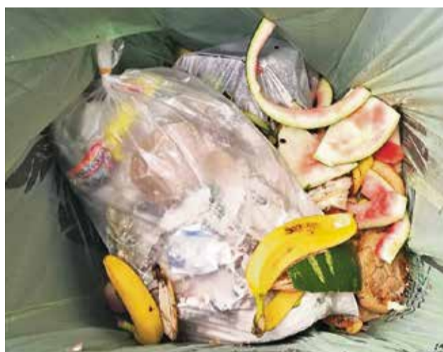
Do hnedej nádoby nepatria žiadne plastové obaly a sáčky!

bo potraviny v pôvodnom obale. Občania sa obrátili na mesto i s konkrétnymi otázkami ohľadom niektorých potravinových zvyškov. Zásady triedenia kuchynského odpadu sa môžu líšiť od domáceho kompostovania, a to najmä v závislosti od spracovateľa odpadu v meste. Bioodpad z Bánoviec nad