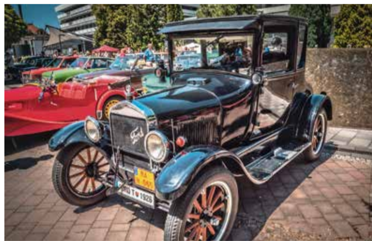
Čierny Ford T je vyrobený 1926, majiteľ s ním prišiel z Lozorna, bol to najstarší veterán tohto ročníka nášho zrazu a zároveň ocenený ako najvzdialenejší účastník

prospech. Hlavne situácia v Trenčianskych Tepliciach bola až do júna o dva stupne horšia ako v Bá-