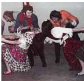
Cigánske tance boli v 70-ych rokoch veľmi obľúbené