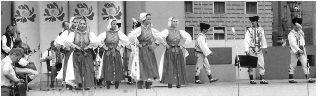
Tatrovák v liptovských krojoch na akcii Kultúrne leto 1989 v Bratislave