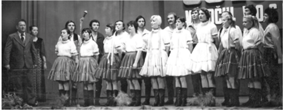
Jedno z prvých vystúpení.