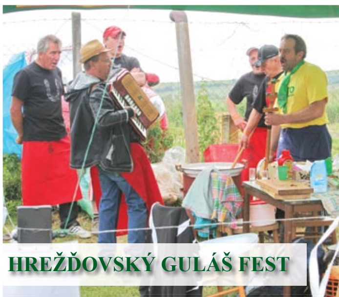
HREŽĎOVSKÝ GULÁŠ FEST