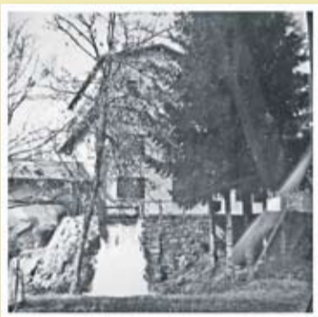
Búranie Strakovičovho mlyna

Pod základnou školou na Duklianskej ulici bol Strakovičov mlyn, ktorý pôvodne vlastnili Kisfaludyovci. V tuhej zime v roku 1929 mlyn vyhořel