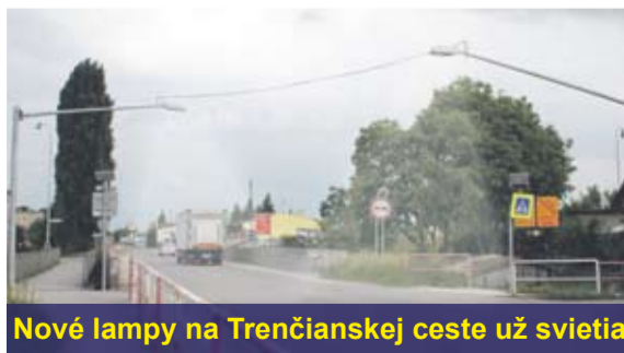
Nové lampy na Trenčianskej ceste už svietia

Pri križovatke, ktorá sa podpísala pod niekoľko dopravných nehôd, sa ukončili práce s budovaním nových lamp. Nad priechodom pre chodcov sa už niekoľko dní nachádzajú dve svetelné zariadenia a viditeľné dopravné značenie. kh