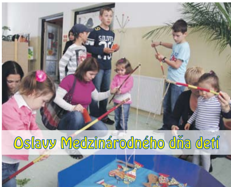
Oslavy Medzinárodného dňa detí

Svoj deň, v ktorý majú dovolené takmer všetko, prišli stovky detí osláviť na podujatie, organizované Centrom voľného času v spolupráci s Mestom Bánovce nad Bebravou. Počasie je už niekoľko dní nepriaznivé, a preto sa oslavy presunuli z parku do Mestského kultúrneho strediska. Na počte atrakcií a výbornej nálade to však nikomu neubralo. Deti sa výborne zabávali v spoločnosti svojich rodičov, starých rodičov a kamarátov.