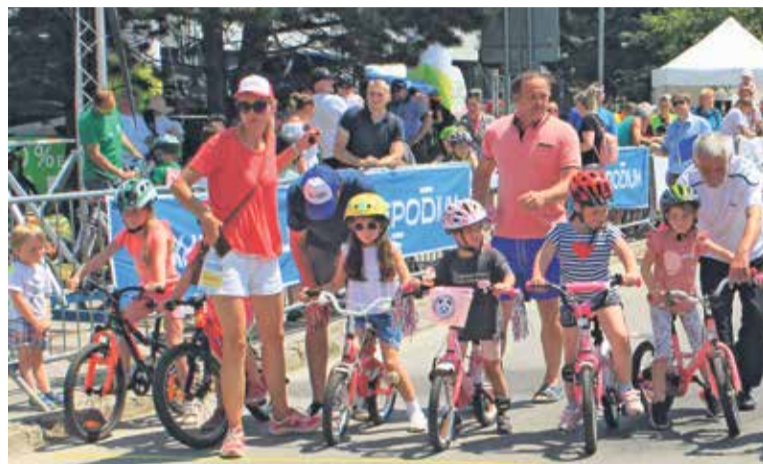
Preteky budúcich majstrov