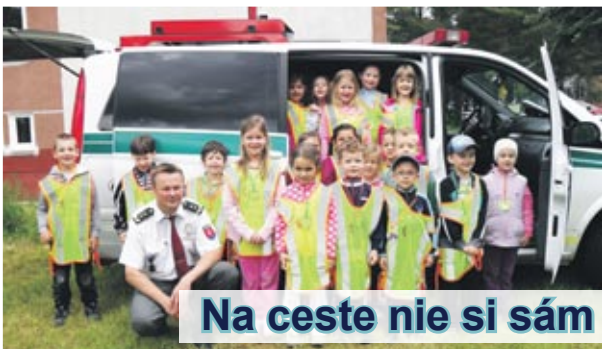
Na ceste nie si sám

Dieťa je už od najútlejšieho veku priamym účastníkom dopravných situácií. Práve deti predškolského veku sú často obeťmi dopravných nehôd, čo bol pre našu materskú školu stimul k realizácii 4. ročníka preventívno-výchovného podujatia pod názvom „Na ceste nie si sám“. Úlohou tejto preventívnej aktivity je formou prevencie upozorniť všetkých účastníkov cestnej premávky na prevzatie zodpovednosti za porušovanie zákonov na cestnej komunikácii a získanie základných vedomostí, zručností a návykov bezpečného správania sa v rôznych dopravných situáciách