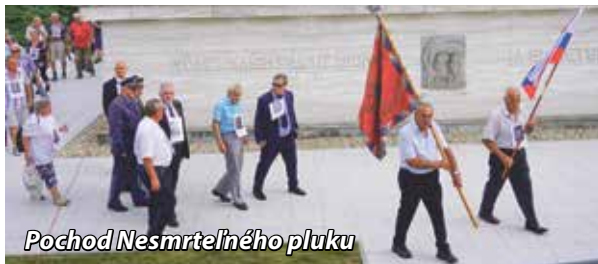
Pochod Nesmrteľného pluku