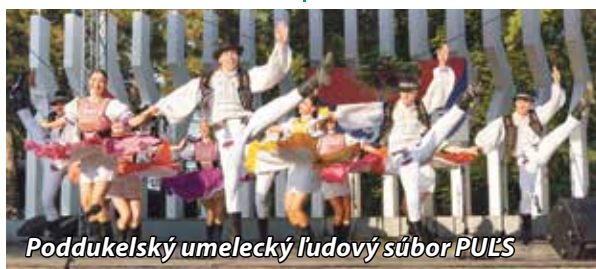
Poddukelský umelecký ľudový súbor PULS

pripomínali hodnoty, ktoré nám naši predkovia zanechali. Myslím si, že žijeme