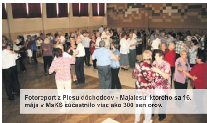
Fotoreport z Plešu dôchodcov - Majálesu, ktorého sa 16. mája v MsKS zúčastnilo viac ako 300 seniorov.