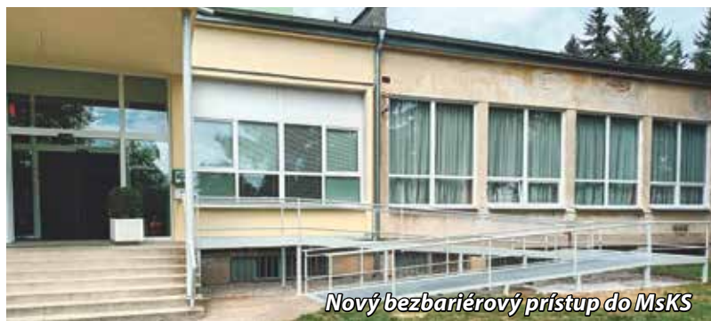
Nový bezbariérový prístup do MsKS

Projekty mesta prebiehajú v stanovenom časovom harmonograme. Presvedčil sa o tom osobne primátor nášho mesta dňa 11. augusta na kontrolnom dni, kedy prešiel s kolegami aktuálne prebiehajúce projekty mesta: Rekonštrukcia vstupu do MsKS, Renovácia ihriska v CVČ a Modernizácia varovného