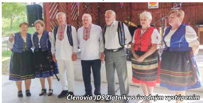
Členovia JDS Zlatníky s úvodným vystúpením

Prítomní seniori zabudli na všetky zdravotné neduhy a venovali sa zábave podľa svojich možností. Celé stretnutie sa nieslo v priateľskom duchu, ožili spoločné zážitky. Nedalo sa poznať kto je z ktorej obce, kto je z ktorej bánovskej firmy. Ťažko sa veru seniori rozchádzali