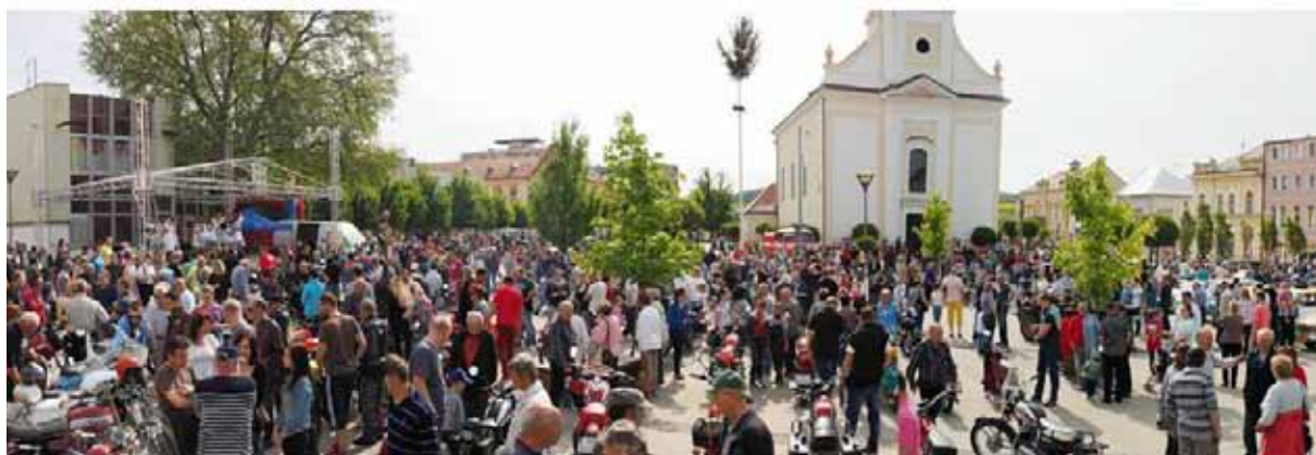
Námestie L. Štúra zaplnili v piatok 8. mája veteráni a ich obdivovatelia...

Informácie s možnosťou prihlásenia sa do Paríža i do Podhájskej môžete získať každý pondelok a streda od 11.00 do 13.00 h v Klube dôchodcov na Farskej ulici alebo na telefóne: 0908 414 414, 0907 493 081.