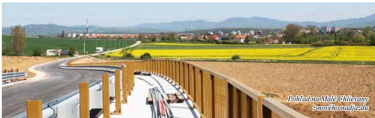
Pohľad na Malé Chlievany z nového nadjazdu

Rýchlostná cesta R2 - obchvat mesta by mal byť podľa plánov dokončený v máji. Pohľad na stavebný ruch z nového nadjazdu nad Malými Chlievanmi tomu však nenasvedčuje. Viac o trampotách tejto prímestskej časti na 2. strane...