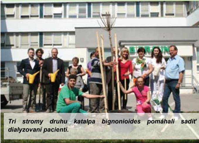
Tri stromy druhu katalpa bignonioides pomáhali sadiť dialyzovaní pacienti.