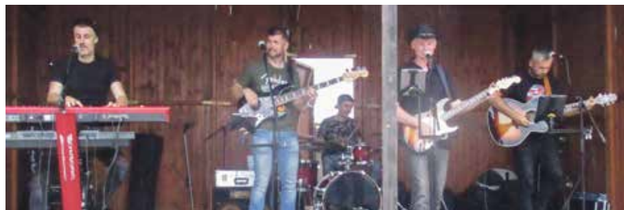
Hudobná skupina Ascalona z Topoľčian a Jadranka s maskotom