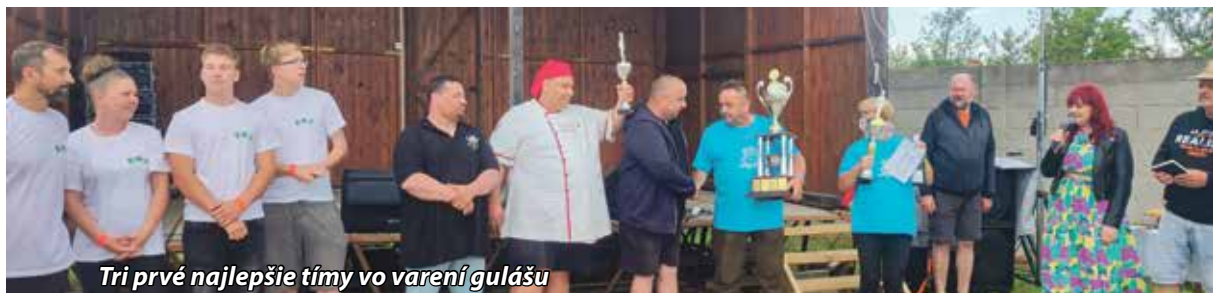
Tri prvých najlepších tímov vo varení gulášu

P riaznivci gulášu a dobrej zábavy sa v sobotu 10. júna zišli na jubilejnom desiatom ročníku majstrovstiev vo varení guláša s názvom Hreždovský Guláš Fest. Areál Kultúrneho domu v Malých Chlievanoch však žil čulým ruchom už niekoľko dní predtým. Členovia výboru mestskej časti, Stolnotenisového klubu Malé Chlievany a dobrovoľníci z radov občanov sa postarali o všetko, čo bolo potrebné – prípravu súťažných sektorov, stanov a sedenia pre účinkujúcich a návštevníkov, občerstvenie a ďalšie dôležité veci.